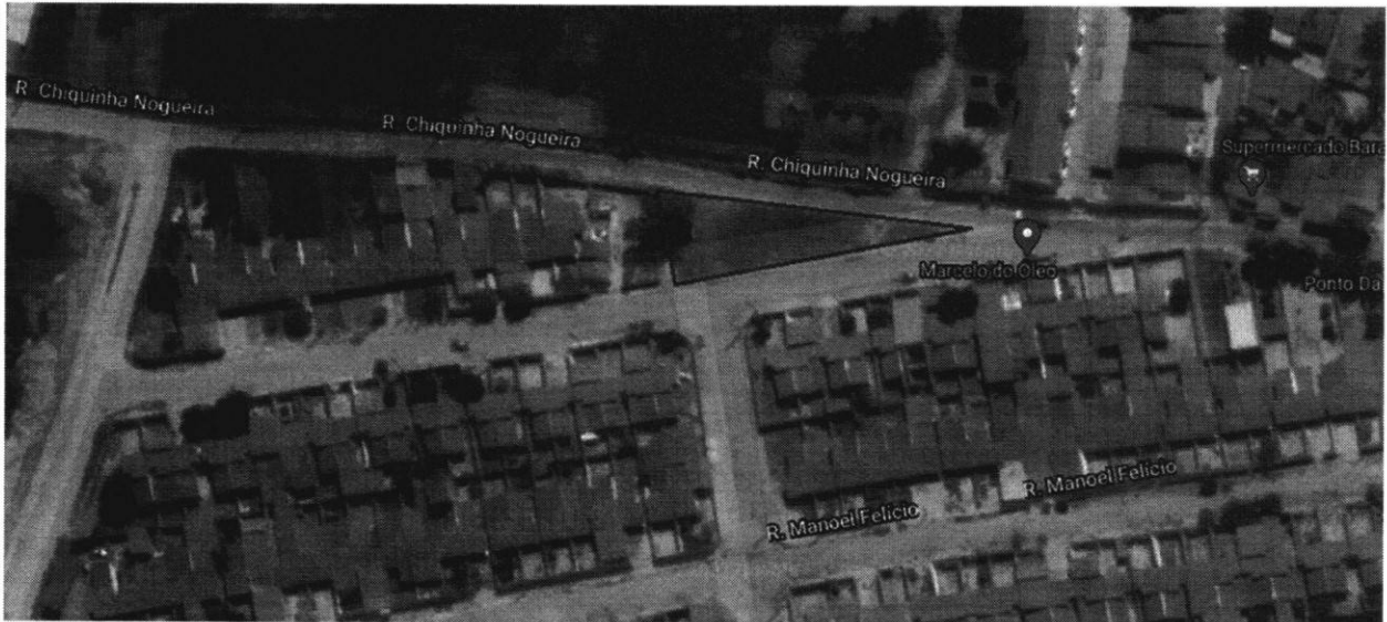
Figura 02: Visão Satélite