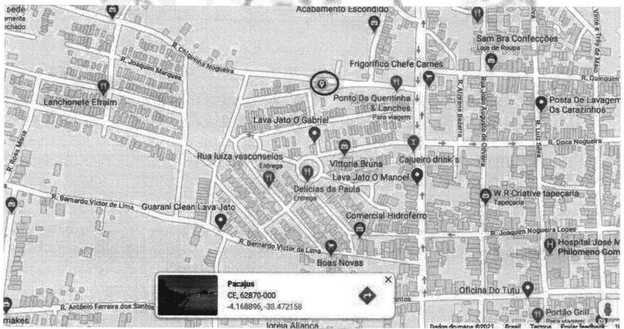
Figura 01: Mapa Localizador

Nota: Será realizada a implantação de uma praça pública visando atender a comunidade local favorecendo a interação, qualidade de vida e segurança para a população. Será realizada a implantação de um playground para as crianças, quiosque, mesas de concreto com assentos, bancos e paisagismo.