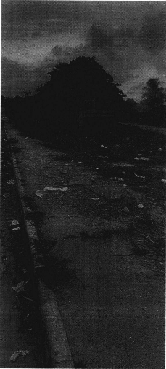
Figura 04: Local existente