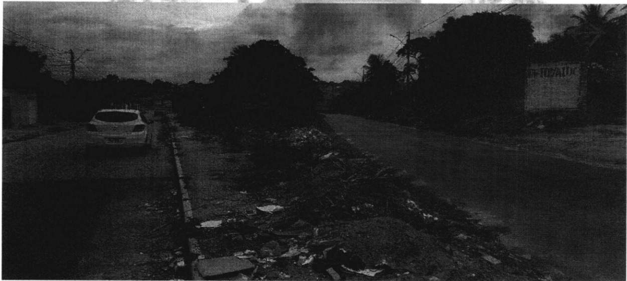
Figura 03: Local existente