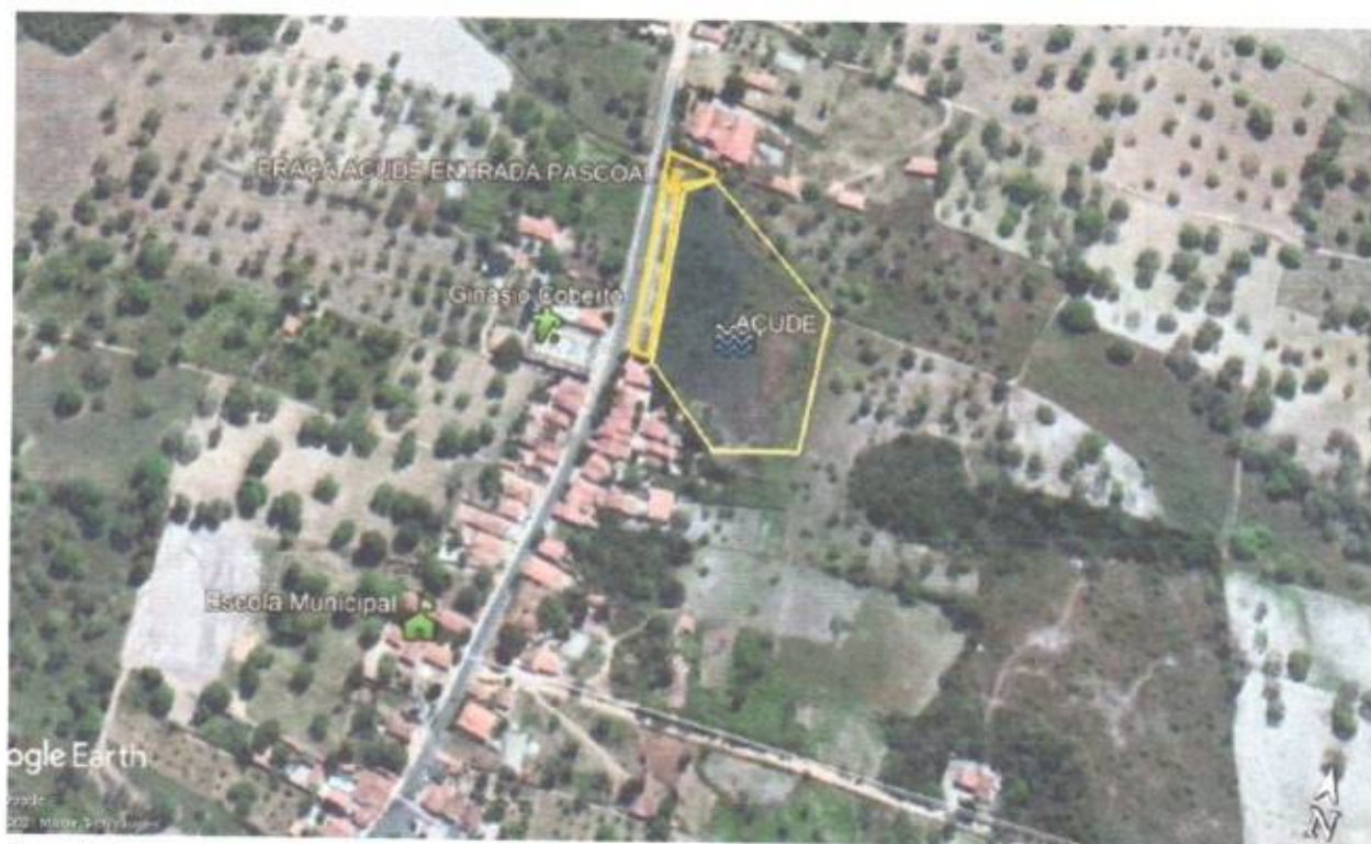
Figura 01: Mapa Localizador