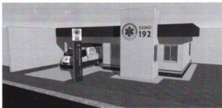
BASE PADRÃO DO SAMU 192

A CONSTRUÇÃO DA BASE DESCENTRALIZADA SERÁ DE INTEIRA RESPONSABILIDADE DA PREFEITURA DE PACAJUS, TRATADA EM CONVENIO COM O GOVERNO DO ESTADO DO CEARÁ, E DEVERÁ OBEDECER A PADRONIZAÇÃO VISUAL DO SAMU 192 COM A PINTURA NAS CORES ESPECÍFICAS E SINALIZAÇÕES ADEQUADAS NA SAÍDA DAS AMBULÂNCIAS ATRAVÉS DE PLACA, SINALIZADORES ELETRÔNICOS OU TOTEM.