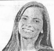
ESTA COLUNA É PUBLICADA AS QUINTAS