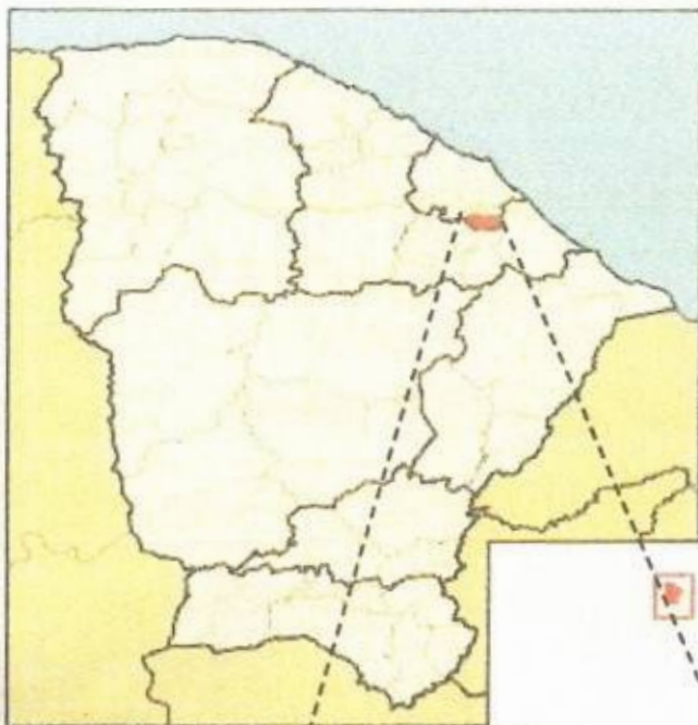
Localização de Pacajus no Ceará