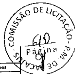
TABELA SEINFRA 026/SINAPI 09/2020 NÃO DESONERADA/PREFEITURA DE PÁCAJUS