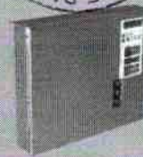
PAINEL DE CONTROLE EXTERNO COM DISPLAY EM CRISTAL LÍQUIDO