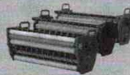
RACKS COM LATERAIS INJETADAS A CORES