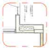
3 - JANELA (CORTA-VENTO)