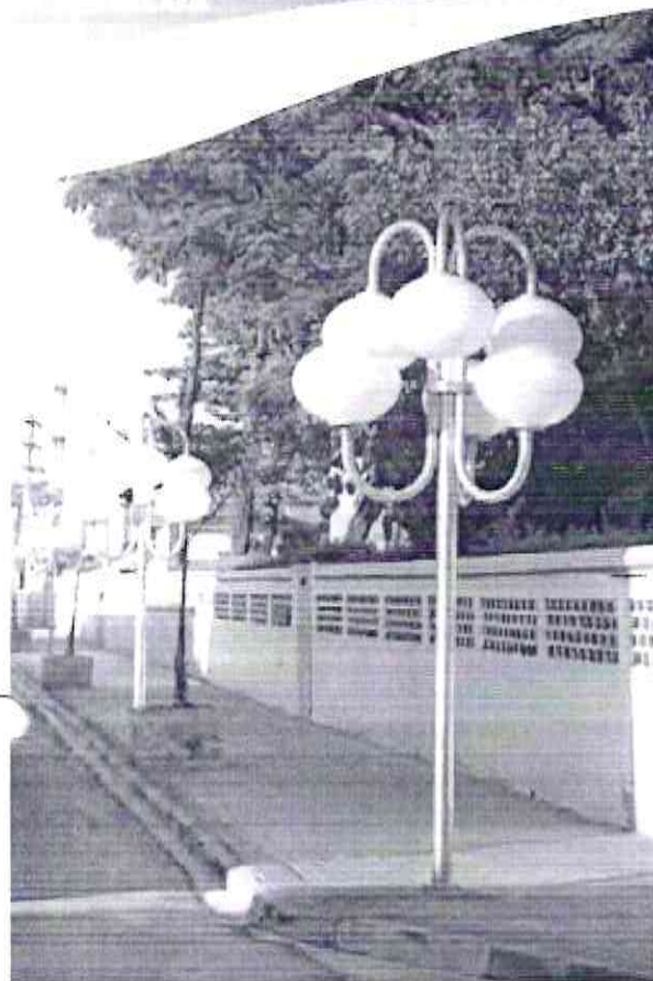
Aparecida - São Paulo

Luminária ND 228 Formato elipsoidal prolato Base de fixação para encaixe em tubo de Ø 60,3 mm Dimensões - Ø 560 x 446 mm Lâmpada vapor de sódio ou metálico até 150W ou lâmpada LED equivalente