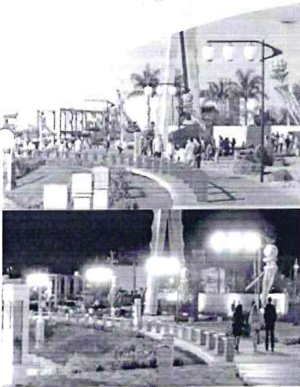
Praça Londrina Dia / Noite - Paraná

Formato oriental Base de fixação para encaixe em tubo de Ø 31,7 mm Dimensões - Ø 462 x 540 mm Lâmpada vapor de sódio ou metálico até 150W ou lâmpada LED equivalente