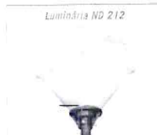
Luminária ND 212

Luminária ND 212 Formato tronco piramidal Base de fixação para encaixe em tubo de Ø 60,3 mm Dimensões - Ø 430 x 585 mm Lâmpada vapor de sódio ou metálico até 250W ou lâmpada LED equivalente