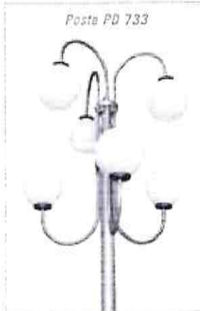
Poste PD 733