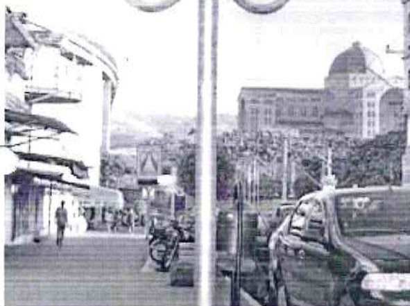
Aparecida - São Paulo

Luminária ND 228 Formato elipsoidal prolate Base de fixação para encaixe em tubo de Ø 60,3 mm Dimensões - Ø 560 x 446 mm Lâmpada vapor de sódio ou metálico até 150W ou lâmpada LED equivalente