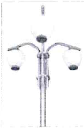
Luminária ND 234