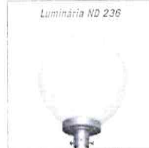
Luminária ND 236

Luminária ND 236 Formato esférico Base de fixação para encaixe em tubo de Ø 48,2 mm Dimensões - Ø 380 x 456 mm Lâmpada vapor de sódio ou metálico até 150W ou lâmpada LED equivalente