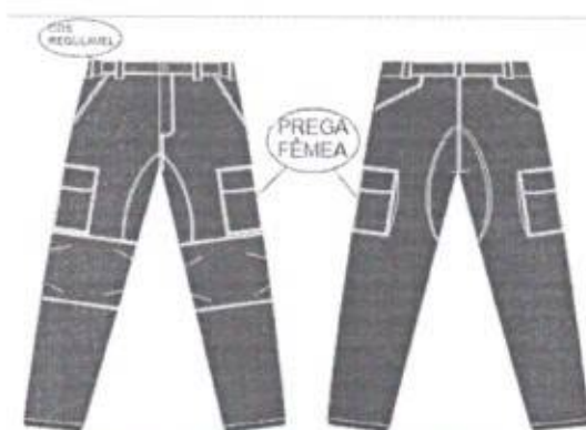
DESENHO MERAMENTE ILUSTRATIVO.

DESCRIÇÃO: Calça em talhe esportivo, cós ajustável com sete passantes. Frente contendo braguilha fechada por zíper, botão e caseado; dois bolsos tipo faca, reforço sobreposto gancho dianteiro e traseiro acrescido até o reforço do joelho sendo duplo anatômico com quatro pences formando um bojo. No traseiro: dois bolsos tipo faca. Nas laterais, dois bolsos fole traseiro, prega fêmea e portinholas, bainha ajustada por elástico.