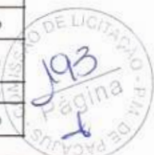
TABELA DE REFERÊNCIA PARA MEDIDAS DE PEÇAS PRONTAS MASCULINA