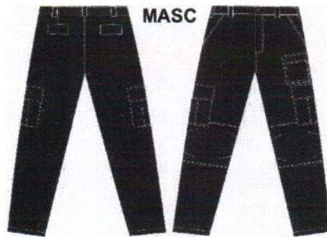
DESENHO MERAMENTE ILUSTRATIVO.