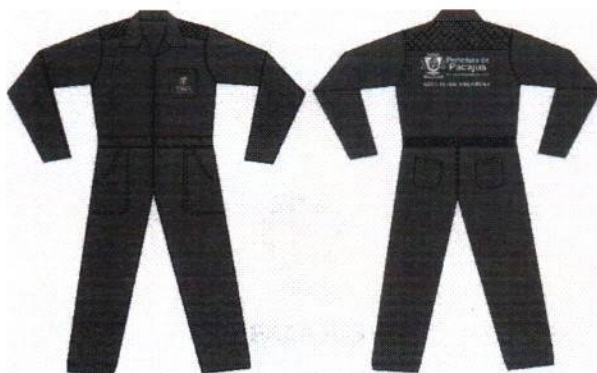
DESENHO MERAMENTE ILUSTRATIVO.