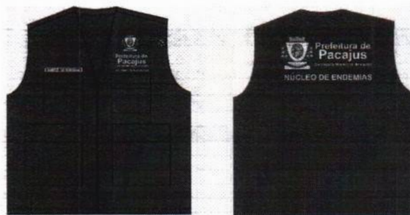
DESENHO MERAMENTE ILUSTRATIVO.