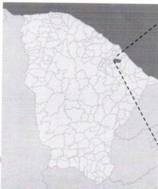
Localização do Município